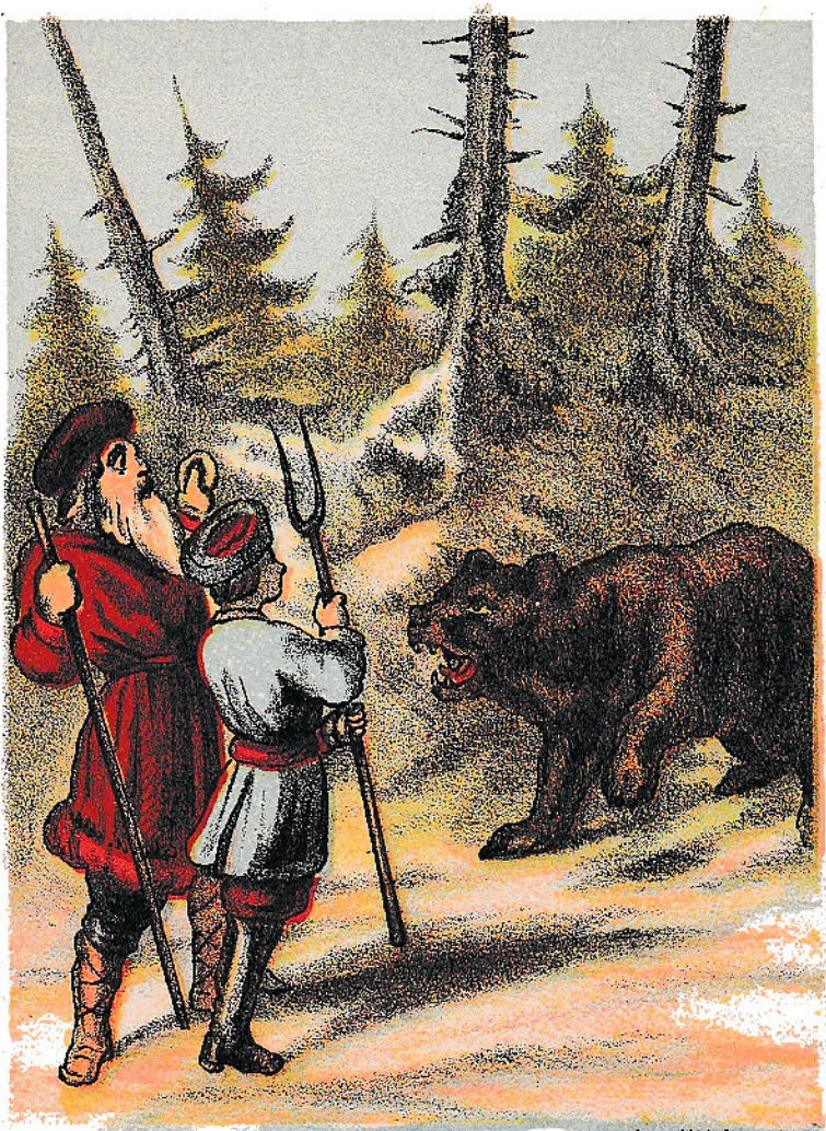
Amend Lith. Amsterdam.