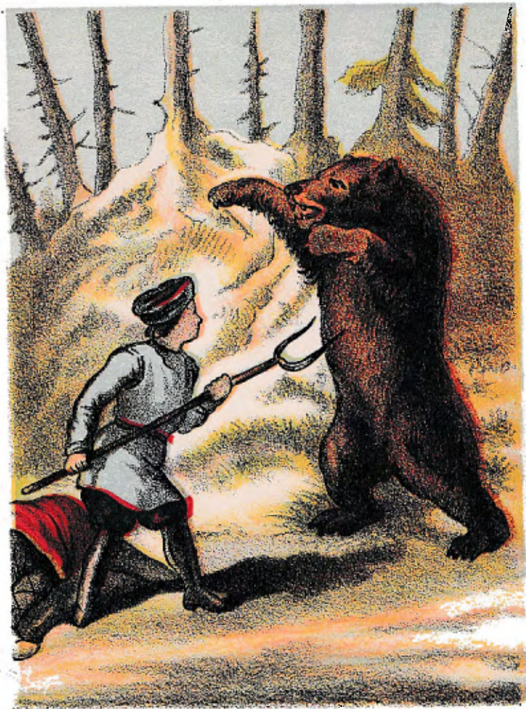
Amend Lith: Amsterdam.